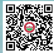
湖南农业大学 成教网络教学公众号