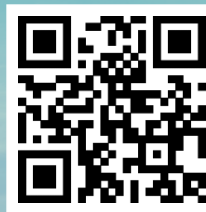
继续教育学院 官方网站